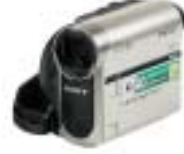
[33] Sony DCR-HC51E