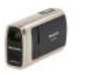
27 Panasonic SDR-SW20EG-S