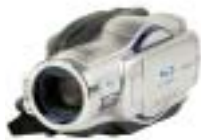
4 Hitachi DZ-BD7HE