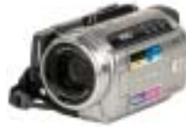
6 Canon HG10E