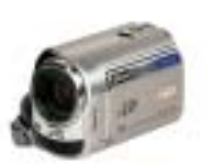
25 JVC GZ-MG365HE