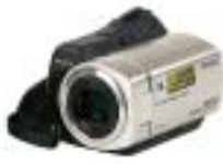
22 Sony DCR-SR35E