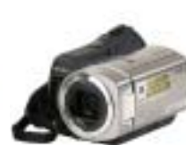
12 Sony VPC-HD700EX