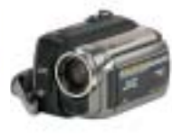
[34] JVC GR-D860E