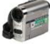
[30] Sony DCR-HC62E