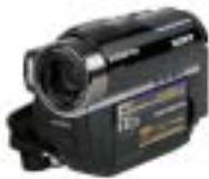
3 Sony HDR-UX19E