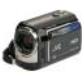
21 JVC GZ-MG435BE