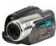
[29] Panasonic NV- GS330EG-S