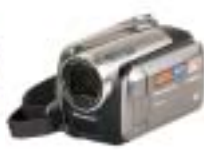
23 Panasonic SDR-H40EG-S