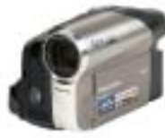
[32] Panasonic NV- GS90EG-S