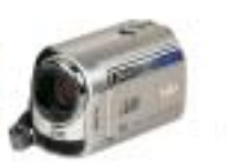
24 JVC GZ-MG330HE