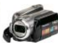
7 Panasonic HDC-HS9EG-S