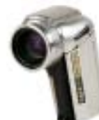
10 Sanyo VPC-HD1000EX