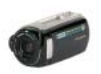
26 Samsung VP- MX10A/XEF