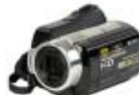
8 Sony HDR-SR10E