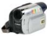
[31] Canon MD215E