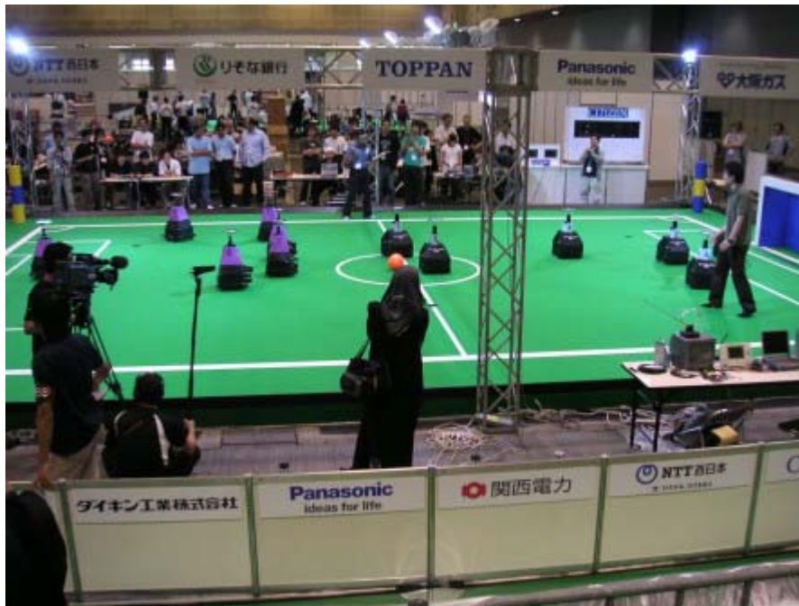
Middle Size League