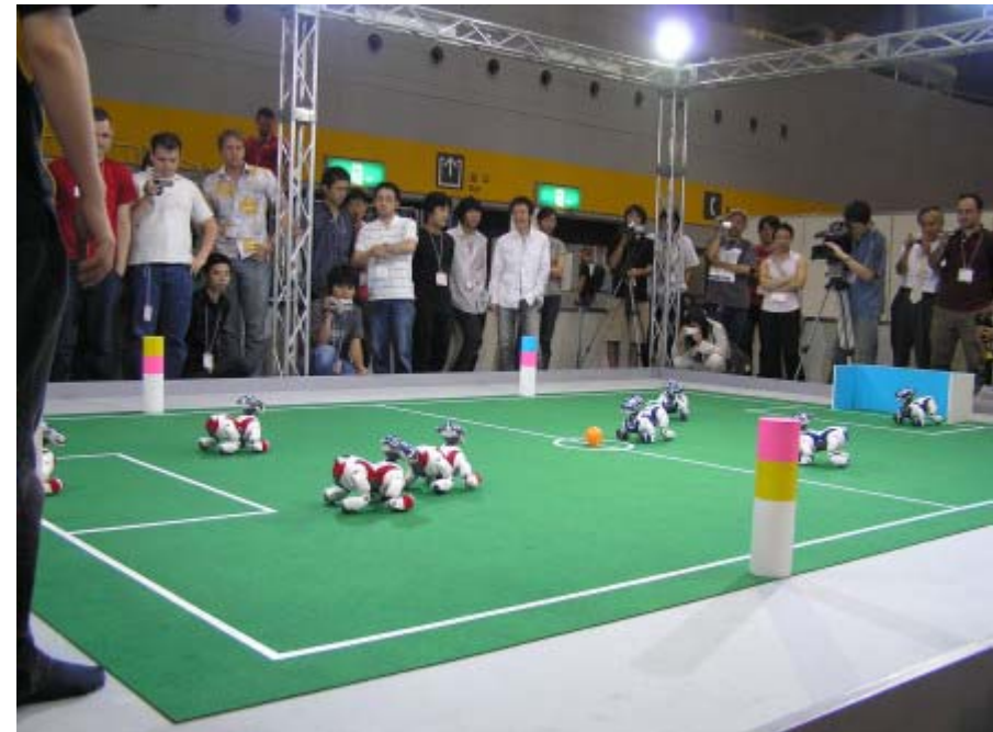
Four Legged League