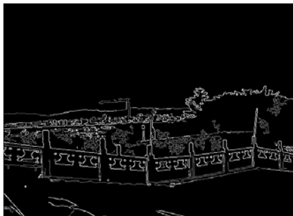
für das Kantenbild ausgewählte schwache und starke Kanten