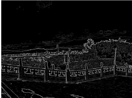
Kantenbild ohne Schwellwerte