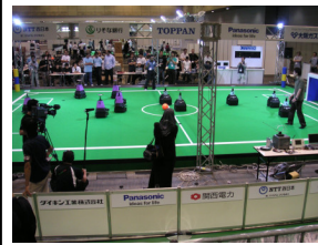
Middle Size League