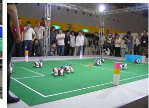
Four Legged League